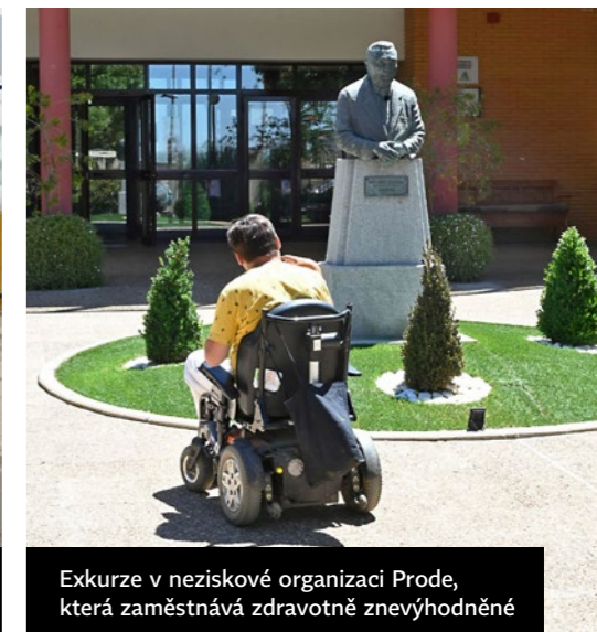
Exkurze v neziskové organizaci Prode, která zaměstnává zdravotně znevýhodněné