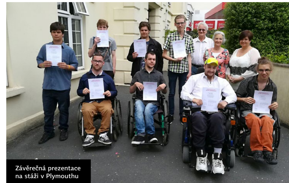
Závěrečná prezentace na stáži v Plymouthu