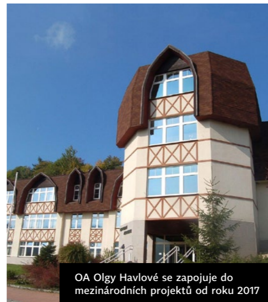
OA Olgy Havlové se zapojuje do mezinárodních projektů od roku 2017

„Nejvíce naplňující jsou pro nás pracovní stáže studentů, neboť pro naše studenty jsou životní zkušenosti a velkou motivací na cestě seberozvoje,“ uvádí Martina Chrastinová. Kolegům z dalších škol by poradila, „aby se nezalekli administrativy související s realizací projektu, sebrali odvahu a využili jedinečných příležitostí, které program Erasmus+ nabízí. Rozzářené oči studentů a nadšení kolegů z nových příležitostí vás přesvědčí, že to všechno rozhodně stojí za to.“