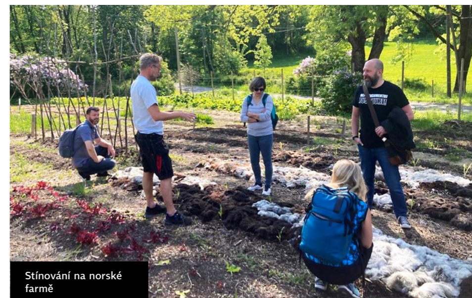
Stínování na norské farmě