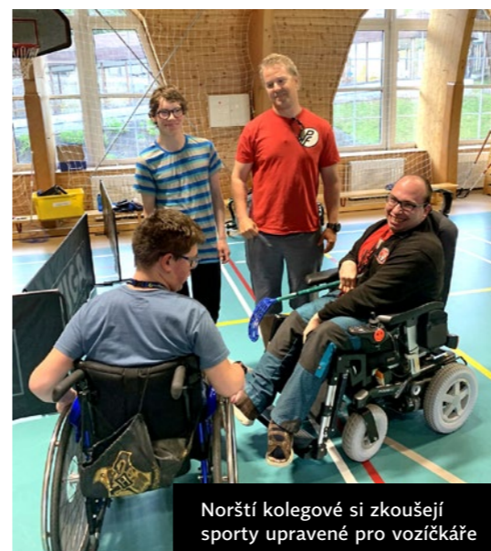
Norští kolegové si zkoušejí sporty upravené pro vozíčkáře