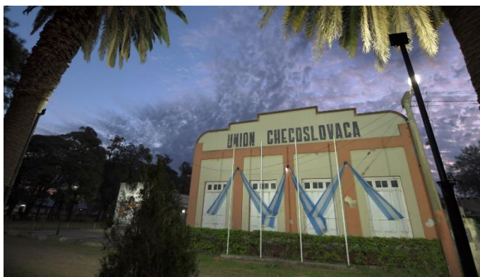
Unión Checoslovaca v Sáenz Peña (hlavní sál)