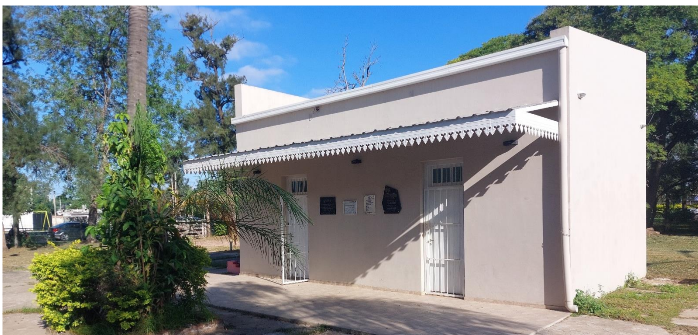
Učebna na Unión Checoeslovaca v Sáenz Peña

V komplexu, v němž spolek sídlí, se nachází několik budov, od muzea přes taneční sál až po dům, kde žije správkyně s rodinou. V předešlých letech probíhala výuka v jedné z místností muzea. Třída byla sice dosti velká, ale značně zastaralá a nevyhovující. Nakonec bylo rozhodnuto, že se učebna přesune do menšího „domečku“, rovněž v objektu spolku, který před lety sloužil jako ubytovna českým učitelům. 1 Díky finančním darům poskytovaným Českou republikou a tvrdé práci krajanů byl tento prostor zrekonstruován. Na konci roku 2024 byla do třídy také přidána klimatizace, která značně zpříjemnila výuku v horkých letních dnech.