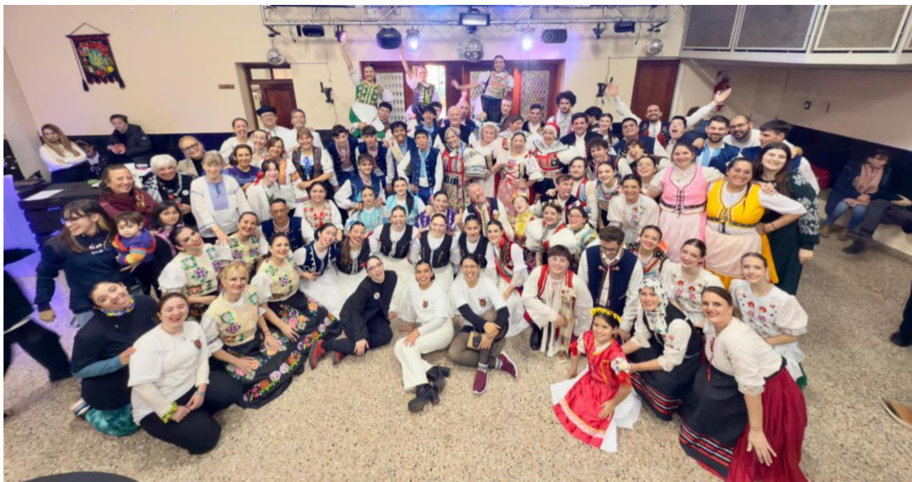
České a slovenské spolky na 14. Festivalu české a slovenské kultury v Latinské Americe

Letos se spolek Sáenz Peña spolu s tanečním souborem Moravanka zúčastnili 14. Festivalu české a slovenské kultury v Latinské Americe, který se tentokrát konal v Berissu. Jedná se o největší festival svého druhu, jenž se každoročně přesouvá do jiného místa a účastní se ho všechny krajanské spolky, taneční i hudebně-pěvecké soubory, ale také samostatné české rodiny a jednotlivci se zájmem o českou a slovenskou kulturu. Festival trval tři dny, během nichž mohli účastníci zhlédnout řadu vystoupení a přednášek nebo se aktivně zapojit do tvořivých dílen spojených s českou a slovenskou kulturou. Především se však jednalo o prostor, kde se mohly všechny spolky setkat, navázat kontakty a strávit společně příjemný čas.