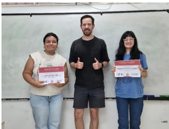
Skupina Nivel 2 UNNE