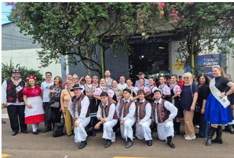
Společné setkání spolků ze Sáenz Peña a Ijuí. / Oba spolky společně s tanečním souborem Moravanka (Ijuí, 2025)