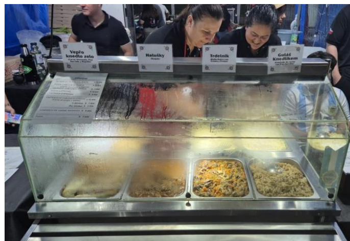
Tradiční stan Unión Checoeslovaca na místních festivalech s nabídkou české a slovenské kuchyně

Kromě běžných školních akcí, které učitel organizuje: Velikonoce, pálení čarodějnic, den dětí, Mikuláš apod., také doprovází spolky při cestách na festivaly a spolupodílí se na přípravách dalších akcí a v neposlední řadě také doprovází návštěvy z různých koutů České a Slovenské republiky, které zavítají do Chaca.