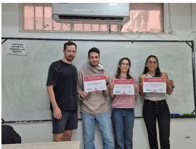
Skupina Nivel 4 UNNE