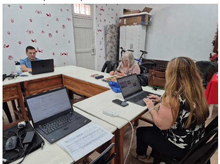
Skupina NIVEL 4 / Skupina NIVEL 2