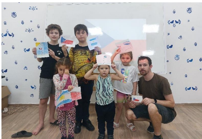
Dětská skupina / Skupina NIVEL 4