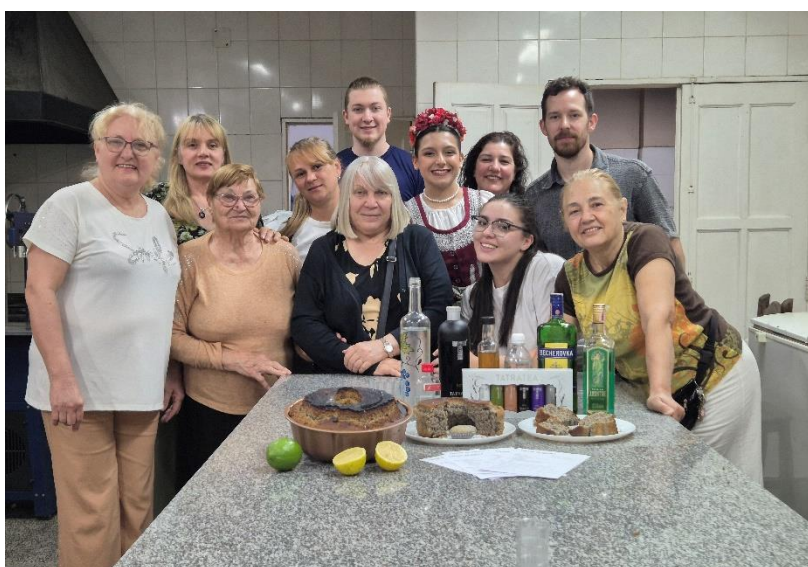
Kurzy české kuchyně v Sáenz Peña

Ve spolku se pořádají další již tradiční kurzy a kroužky. Letos například proběhl tradiční kurz vaření, pořádaný učitelem s velkou podporou samotné komunity. Je nutno vyzdvihnout, že tyto kurzy jsou téměř vždy obohacené samotnými krajany a studenty se silným zájmem o českou kulturu.