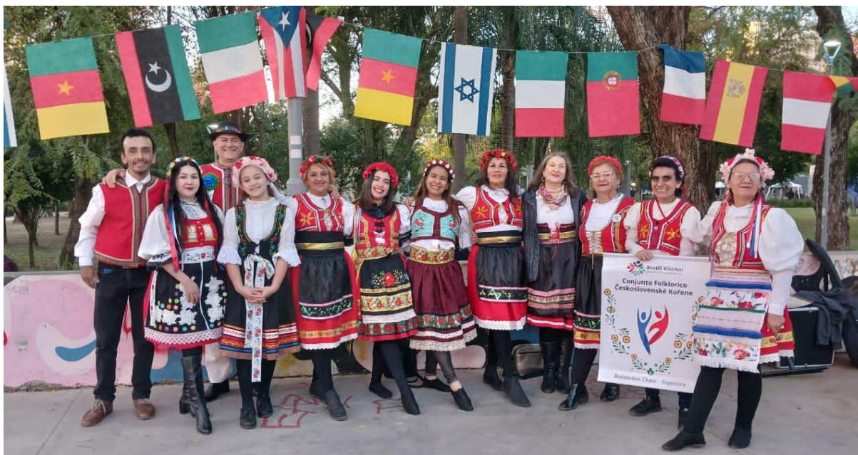
Členové spolku účastníci se 21° Fiesta Municipal del Inmigrante