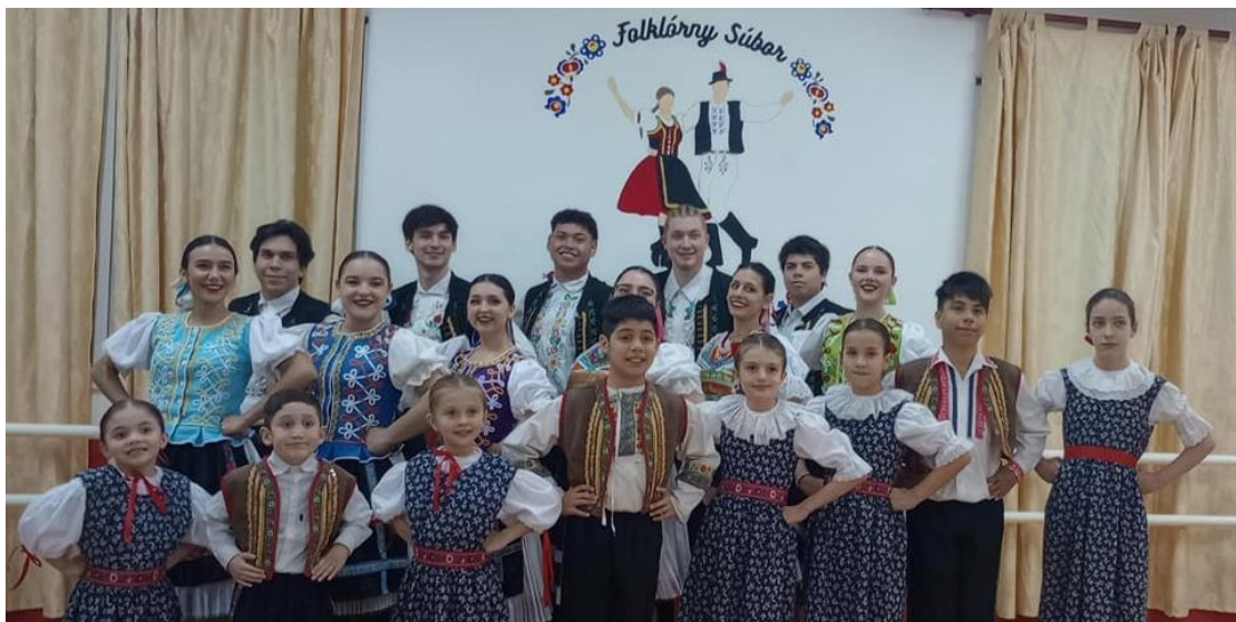
Folklorní soubor Moravanka