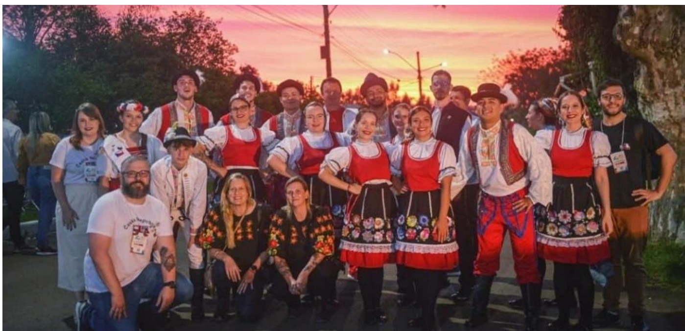
Členové spolku Colectividad Checa de Misiones na návštěvě festivalu v brazilském Ijuí