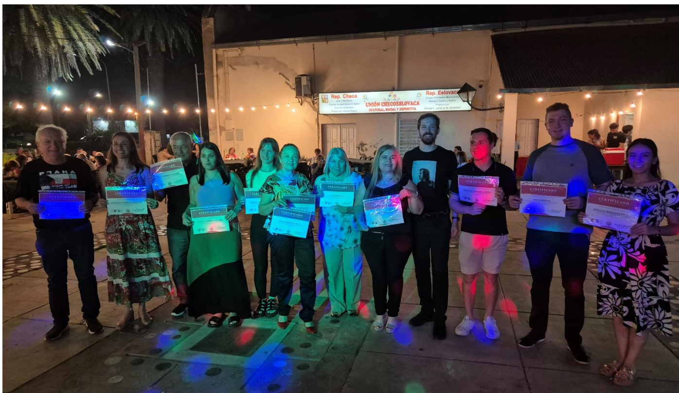
Předávání diplomů v Sáenz Peña (2025)

V současné době je získávání nových studentů k prezenční výuce českého jazyka v provincii značně obtížné, bilance počtu nových studentů bývá spíše negativní, ale ne vždy. Pokračuje se v kurzu pro děti, který časově navazuje na účast ve folklorním souboru Moravanka , spadající pod spolek.