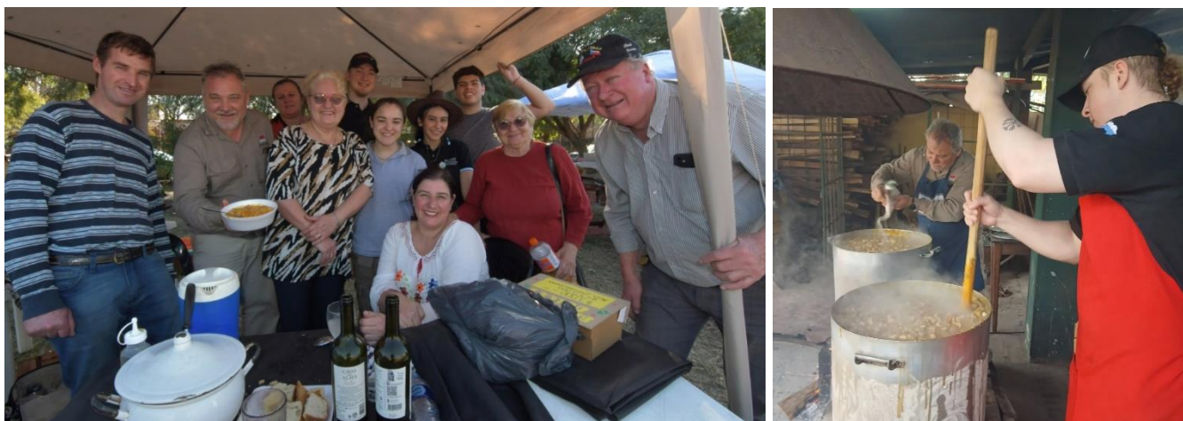
Šampionát ve vaření locra (2025)

Co se týče účasti na akcích či jejich samotné pořádání, bývá spolek obvykle velice aktivní (průměrně 2–3x do měsíce se spolek účastní nějaké akce, nebo sám akci pořádá). Během roku spolek uspořádal několikrát prodej „locra“ – typického předkolumbovského jídla – a uzenin, které se udí přímo ve spolku. Místní lokro je mezi místními obyvateli velmi populární a v soutěžích se každoročně umísťuje na předních příčkách. Během roku se také zorganizovalo několik společenských obědů či večeří, obvykle s účastí 200 až 300 lidí a vystoupením Moravanky , přehlídkou krojů apod.