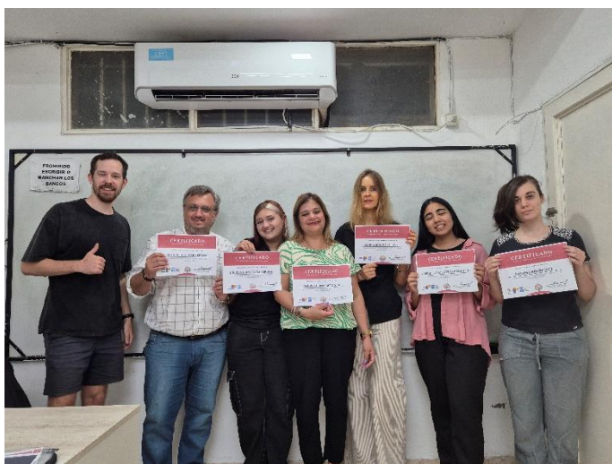
Skupina Nivel 1 UNNE