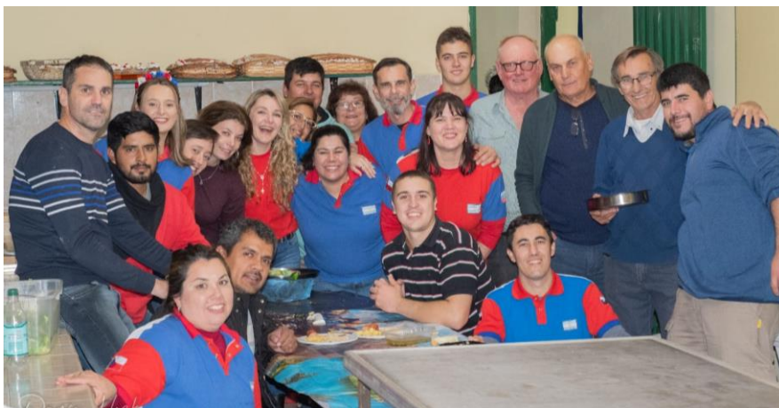
Spolek v Las Breñas