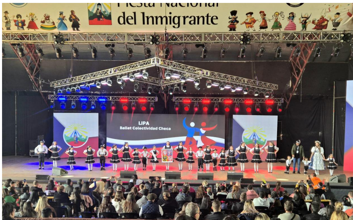
Mladší členové spolku Colectividad Checa de Misiones