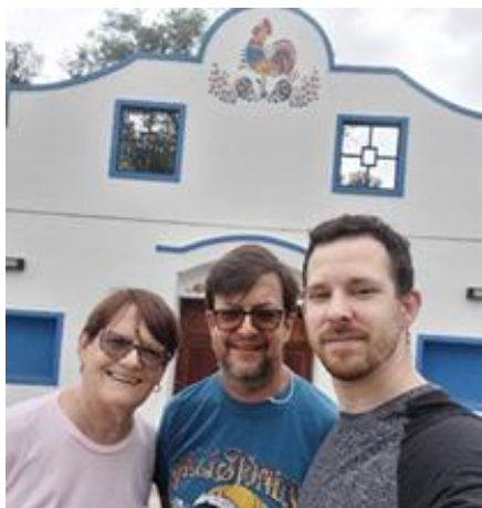
Předseda a místopředsedkyně spolku

Krajané se během roku podílejí na různých gastronomických a dalších jarmarcích. Hlavní akcí je pak každoročně zmiňovaný festival Fiesta Provincial del Inmigrante , kde hlavní atrakcí je volba královny přistěhovalců v rámci provincie. Je již tradicí, že se festivalu účastní velké zastoupení krajanů ze Sáenz Peña. Rok 2025 byl pro tuto komunitu opět velmi příznivý a bohatý.