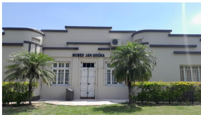
Museum Jana Osíčky

Co se týče výuky v destinaci, prezenční hodiny češtiny v Sáenz Peña probíhaly ve středu a čtvrtek. Věk studentů: ~6–70 let. Rozdělení do skupin bylo následující: