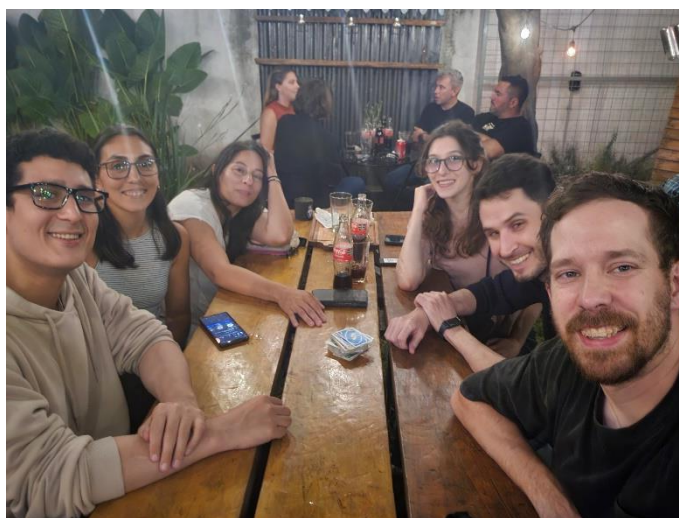
Závěrečné posezení se studenty

Celkový počet studentů byl v podstatě stejný jako v předchozím roce. Většinou se jedná spíše o jazykové nadšence než o potomky krajanů. V zimním semestru absolvovalo kurz jazyka více studentů než v semestru letním, někteří od jazyka upustili (často z důvodu změn univerzitního rozvrhu mezi semestry, změn v práci apod.). Na příští rok je výuka naplánovaná opět na pátky, aby mohl učitel bez problémů dojíždět (cca 3,5–4 hodiny autobusem). Nevýhoda je, že hodiny končí v 9 hodin večer a není možnost návratu do místa bydliště. Učitel tedy musí každý pátek využít některý z hotelů v centru města a vrátit se v sobotu zpátečním autobusem ve 12 hodin odpoledne s návratem před 16. hodinou.