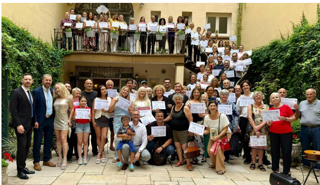
Slavnostní předávání diplomů na Velvyslanectví ČR v BA (2025)

Učitel obvykle spolupracuje s velkým množstvím lidí, ať už se jedná o kolegy v rámci Programu podpory českého kulturního dědictví v zahraničí (v rámci Jižní Ameriky) – tato spolupráce je vždy obohacující a přináší mnoho pozitivních poznatků. Dále pak s místními učiteli a profesory na základních, středních či vysokých školách; s návštěvami z Česka a Slovenska, jako jsou akademici a výzkumníci, nebo i běžní cestovatelé a dobrodruzi. V neposlední řadě je spolupráce v průběhu roku vedena také se ZÚ v Buenos Aires, který je učitelům vždy k dispozici. Učitel spolupracuje také s médii, převážně se jedná o lokální rádia a televizní stanice. Nakonec je vhodné zmínit i spolupráci s rodinami v Česku, které během let ztratily kontakt se svými příbuznými z Chaca a jejich pokročilý věk jim nedovoluje se s nimi spojit tradičním způsobem. Učitel usnadňuje tuto komunikaci a zprostředkovává kontakt.