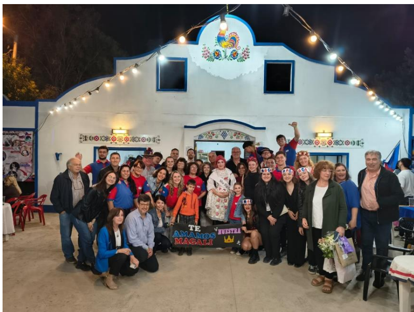
Festival imigrantů v Las Breñas