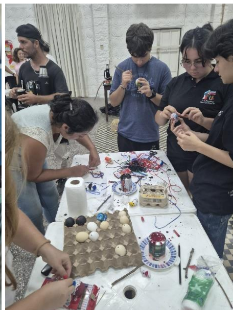
Velikonoce s tradičními aktivitami (pletení pomlázky, malování vajec)

Další události, které se konaly v průběhu školního roku a na kterých se učitel podílel jako pomocník při organizaci, moderátor, člen komunity apod., byly například: Oslava Dne imigrantů v Argentíně, dříve zmíněné veletrhy a jarmarky pořádané obcí nebo samotným Svazem krajanských komunit.