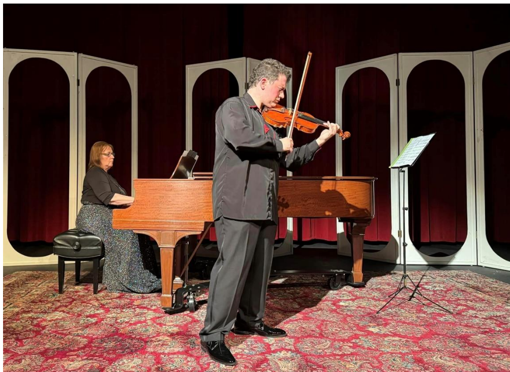
Duo Ambroš v Chopin Theatre.

V březnu také proběhl další z cyklu online workshopů pro učitele. Na workshop s tématem „Jak na online výuku (dětí i dospělých)“ se přihlásilo celkem 34 lektorů a učitelů nejen z USA a setkal se s pozitivními ohlasy.