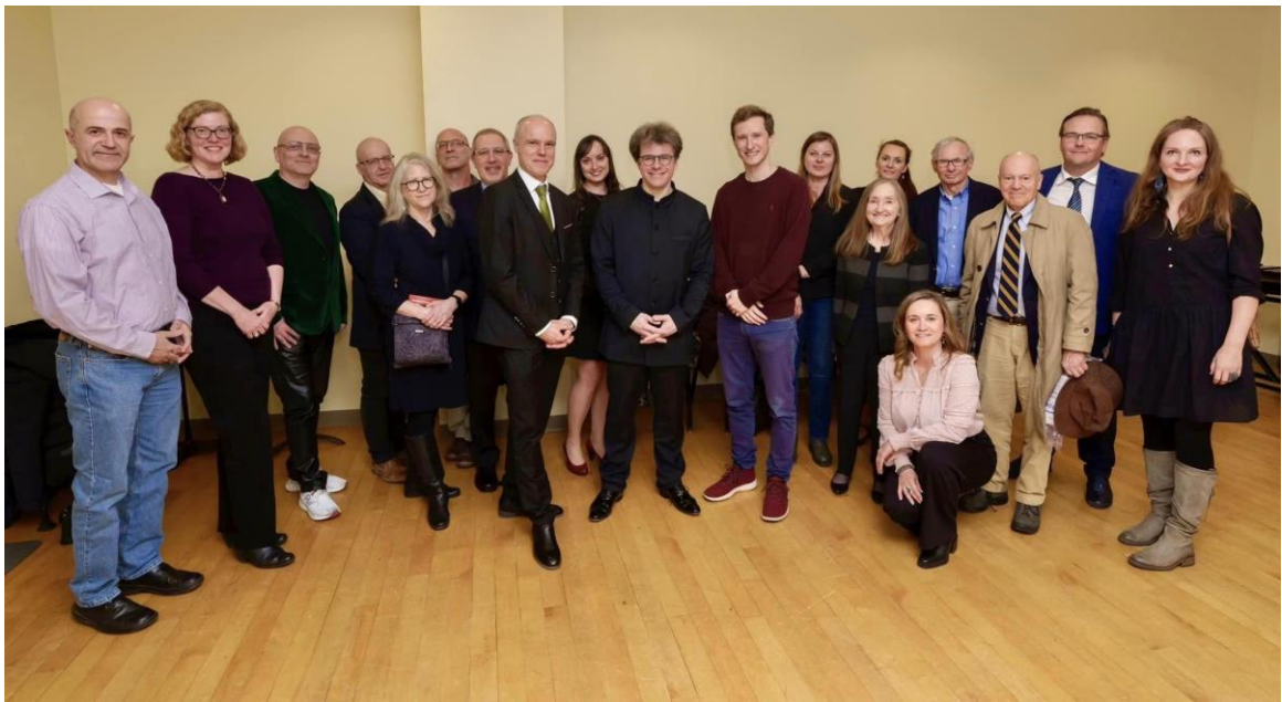
Setkání s dirigentem Jakubem Hrušou a houslistou Josefem Špačkem v Chicago Symphony Orchestra.