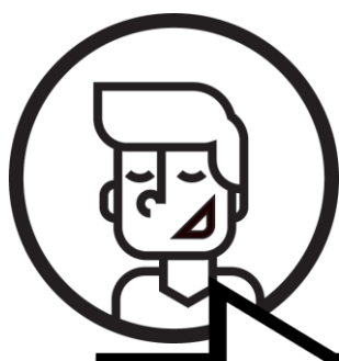
DIAGRAM MOŽNÝCH ÚČASTÍ V AKTIVITÁCH DOBROVOLNICTVÍ:

KRÁTKODOBÉ A NÁRODNÍ DOBROVOLNICTVÍ JE NOVĚ PRO VŠECHNY, NEJEN PRO MLADÉ LIDI S OMEZENÝMI PŘÍLEŽITOSTMI.