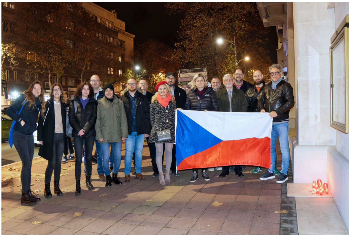
Pochod k 17. listopadu