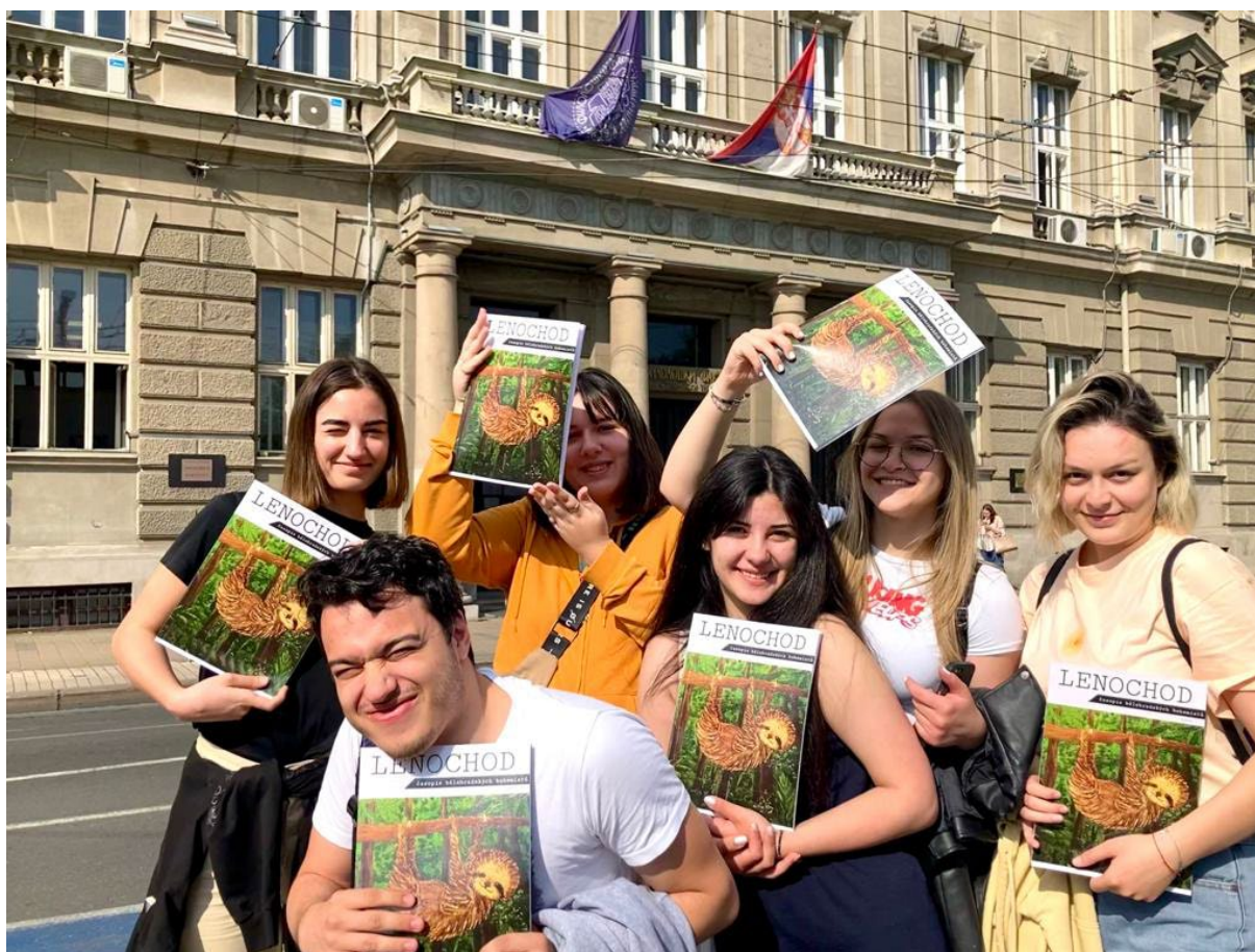
Vydání dalšího čísla školního bohemistického časopisu Lenochoď