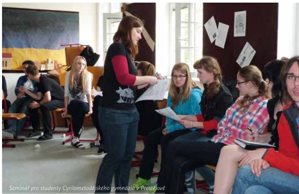
Seminář pro studenty Cyrilometodějského gymnázia v Prostějově